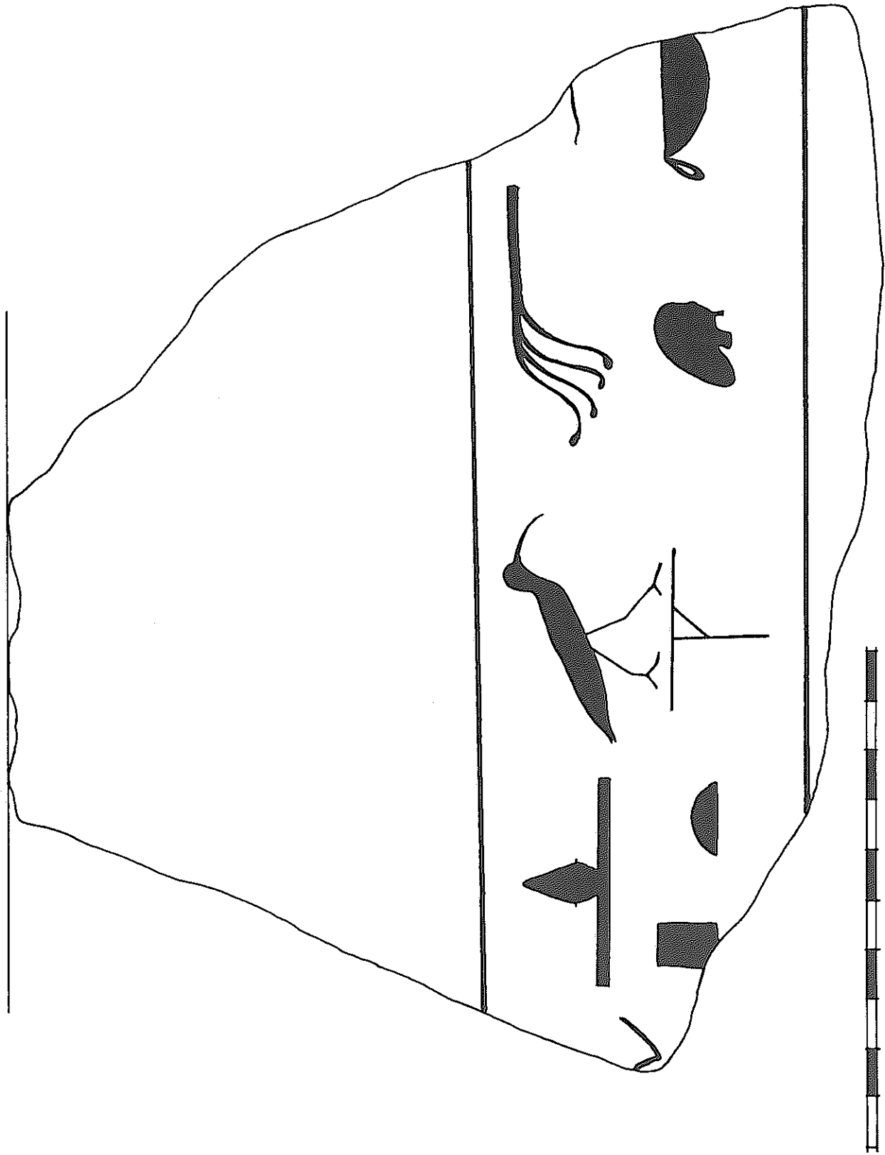
Lám. II. Fragmento de vaso egipcio aparecido en la provincia de Cuenca.